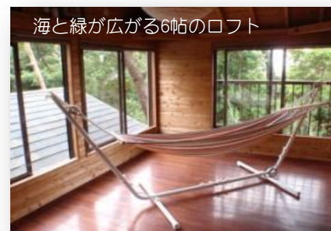
海と緑が広がる6帖のロフト