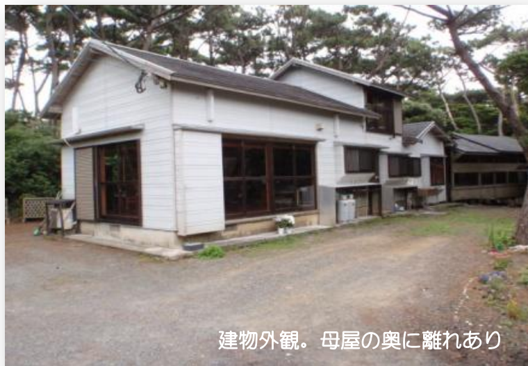
建物外観。母屋の奥に離れあり

売家 敷地 157坪 所在地 鹿児島県大島郡龍郷町赤尾木1747-2 地目 原野 地勢 穏やかな傾斜地、若干部分により高低差あり 法令制限 都市計画区域内の未線引き区域 延床面積 25坪（付属建物あり） 築年数 築後11年 接道状況 西側に幅 3.5mの未舗装道路に隣接 設備 電気・公営水道・水洗 交通手段 奄美空港より12km 特徴 近くに人気のサーフスポットの手広海岸があり、周辺には話題のペンションレストラン、カフェが建つ。 取扱業者 南海観光 0997-53-3101 媒介