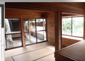
風が抜ける6帖の和室