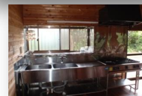
キッチン設備はプロ仕様 ダブルシンクとハイカロリーガスコンロ