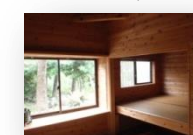
上げ床になって いる2帖の和室