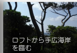
ロフトから手広海岸を臨む